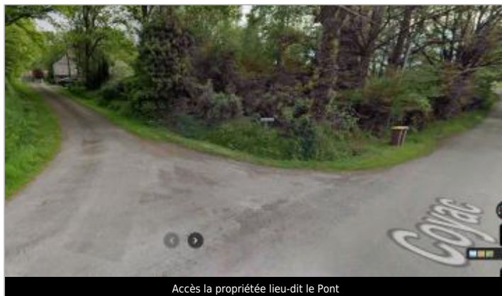
Accès la propriété lieu-dit le Pont

Coordonnées WGS84 : X: -2.16103221 / Y: 47.69076340