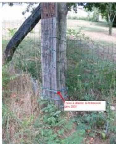
Poteau matérialisant le repère

Type de repérage : Campagne de terrain post-inondation