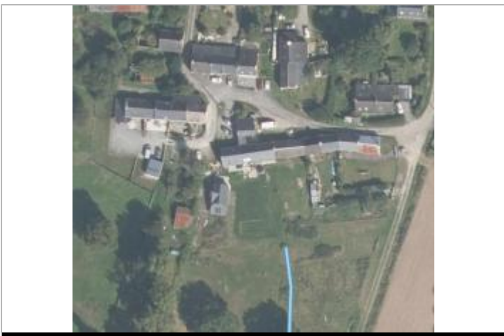
Vue aérienne lieu-dit Coyac

GÉOLOCALISATION Coordonnées WGS84 : X: -2.16558090 / Y: 47.69148460 Coordonnées RGF93 (Lambert 93) X: 312786.9 / Y: 6745013.87 Coordonnées RGF93 (ETRS89) : X: -2.1655809 / Y: 47.6914846 Code Hydro: J88-0300 Rive de référence: Gauche