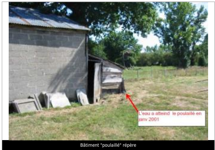
Bâtiment "poulaillé" repère

MARQUE Maximum de l'inondation : Oui Visibilité : Non État du repère : Moyen Pérennité : Non renseigné