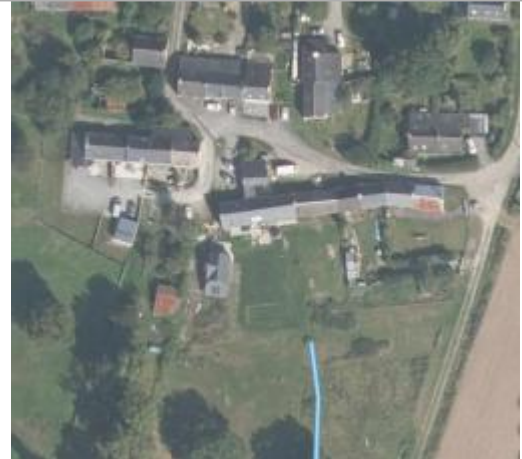
Vue aérienne lieu-dit Coyac