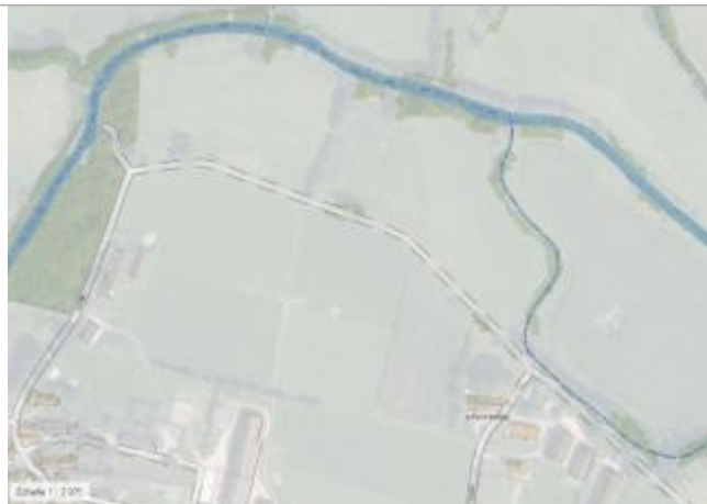
Vue aérienne lieu-dit le Val