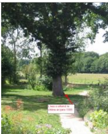
Paysage localisation de l'arbre de référence

Type de repérage : Campagne de terrain post-inondation