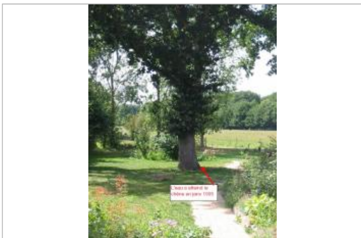
Paysage localisation de l'arbre de référence