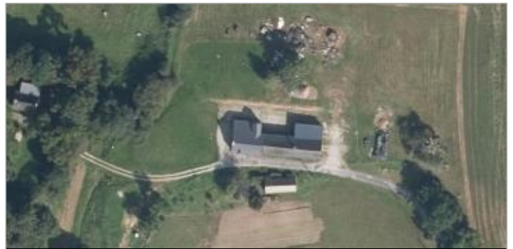
Le Gué de l'Epine

GÉOLOCALISATION Coordonnées WGS84 : X: -2.25892404 / Y: 47.71033770 Coordonnées RGF93 (Lambert 93) X: 305939.54 / Y: 6747565.72 Coordonnées RGF93 (ETRS89) : X: -2.258924 / Y: 47.7103377 Code Hydro: J88-0300 Rive de référence: Gauche