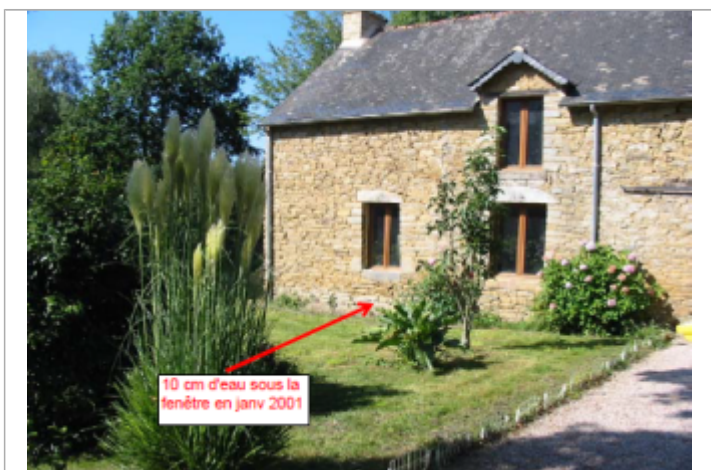
Bâtiment repère au Gué de l'Epine

MARQUE Maximum de l'inondation : Oui Visibilité : Non