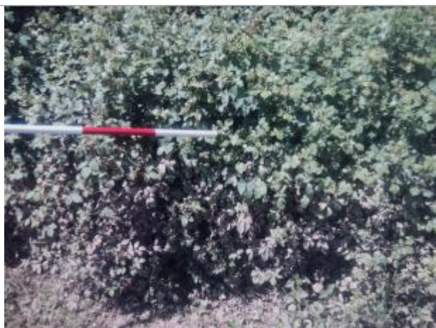
Vue du repère - auteur : Artelia

Altitude calculée de l'eau (en m) : 87.73 m