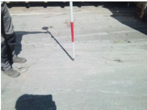
Vue du repère - auteur : Artelia

Altitude calculée de l'eau (en m) : 89.71 m