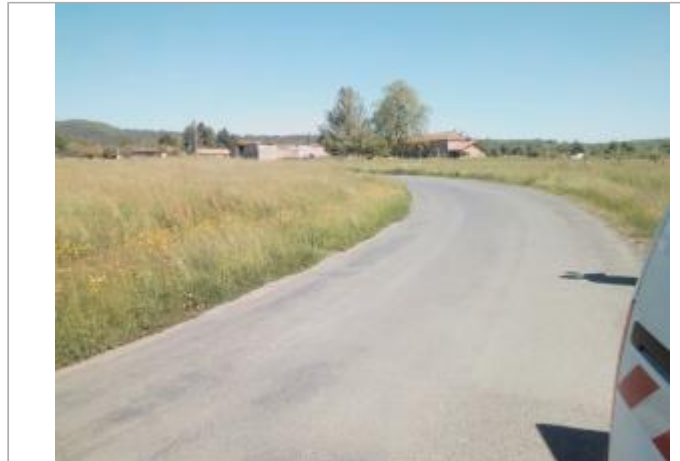
Vue du site - auteur : Artelia

Coordonnées WGS84 : X: 0.79150920 / Y: 45.19406430