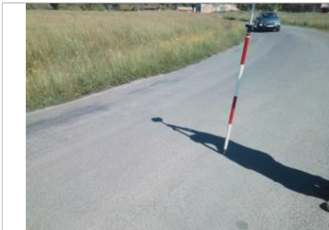
Vue du repère - auteur : Artelia

Altitude calculée de l'eau (en m) : 89.96 m