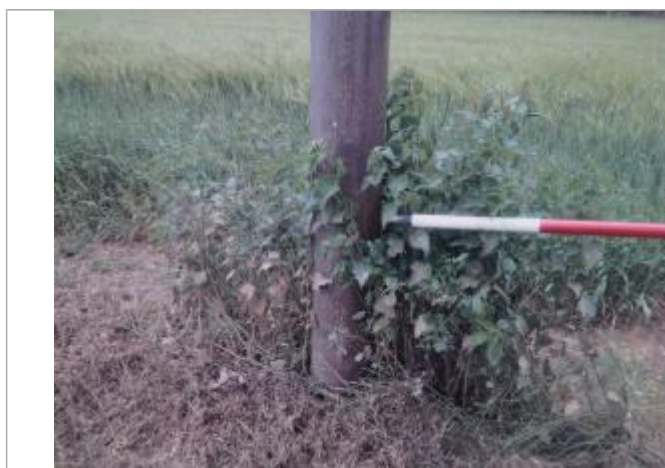
Vue du repère - auteur : Artelia