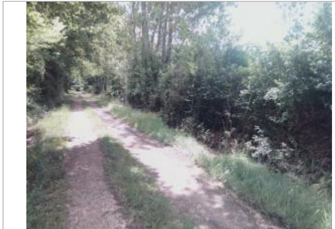
Vue du site - auteur : Artelia

Coordonnées WGS84 : X: 0.87217070 / Y: 45.18660930