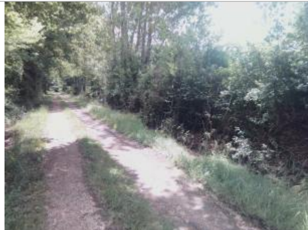
Vue du site - auteur : Artelia