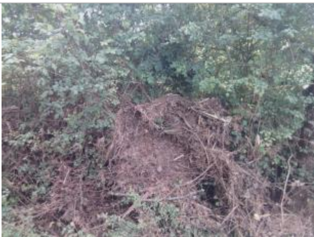
Vue du repère - auteur : Artelia

Altitude calculée de l'eau (en m) : 98.73 m