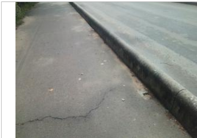
Vue du repère - auteur : Artelia

Altitude calculée de l'eau (en m) : 86.51 m