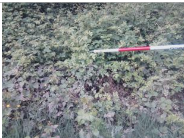
Vue du repère - auteur : Artelia