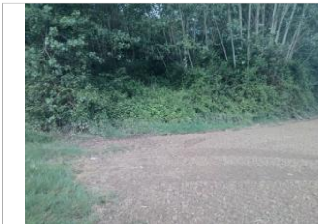
Vue du site - auteur : Artelia

Coordonnées WGS84 : X: 0.63572380 / Y: 45.19245450