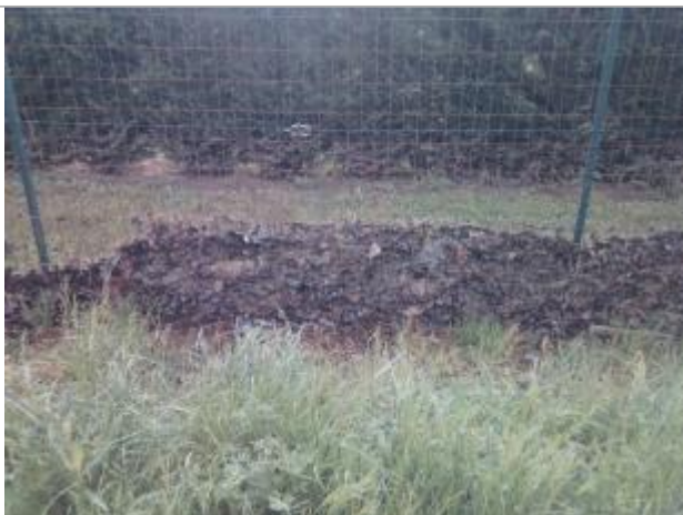
Vue du repère - auteur : Artelia