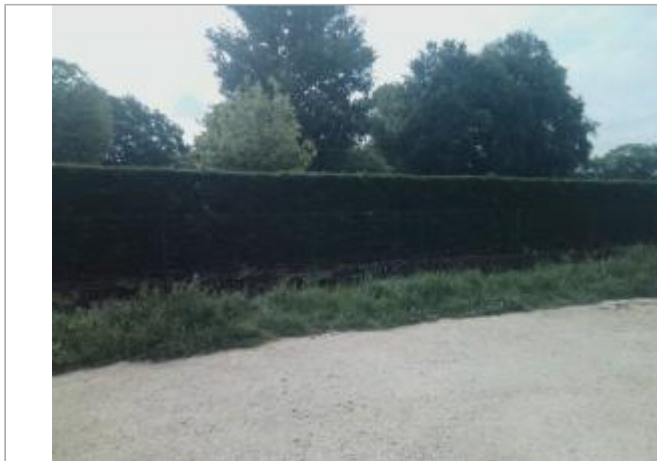
Vue du site - auteur : Artelia

Coordonnées WGS84 : X: 0.62223330 / Y: 45.19194420