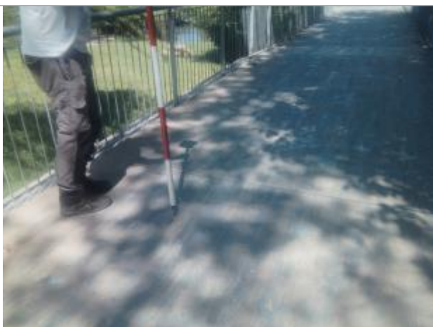
Vue du repère - auteur : Artelia