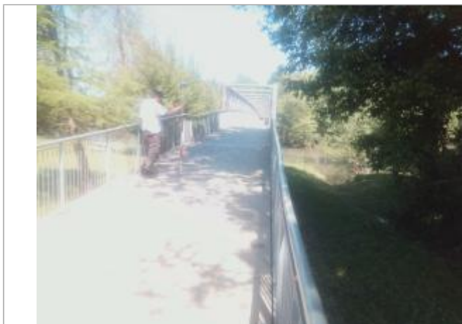
Vue du site - auteur : Artelia

Coordonnées WGS84 : X: 0.66149330 / Y: 45.18798140