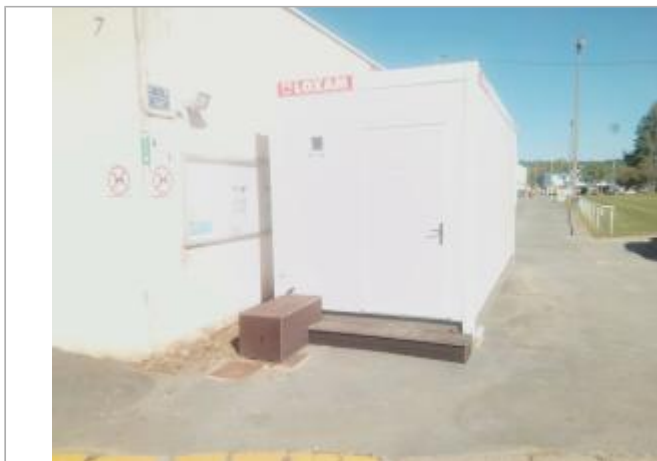
Vue du site - auteur : Artelia

Coordonnées WGS84 : X: 0.70096150 / Y: 45.18934720