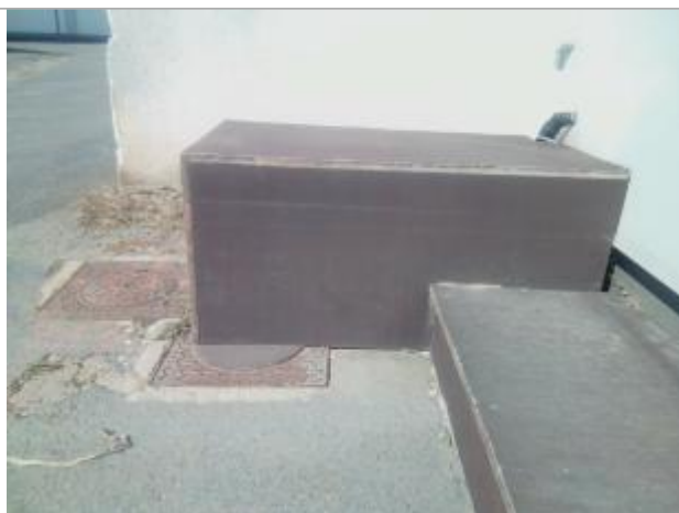
Vue du repère - auteur : Artelia