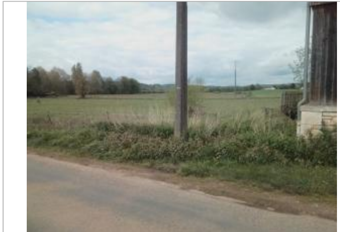
Vue du site - auteur : Artelia

Coordonnées WGS84 : X: 1.10685930 / Y: 45.28371270