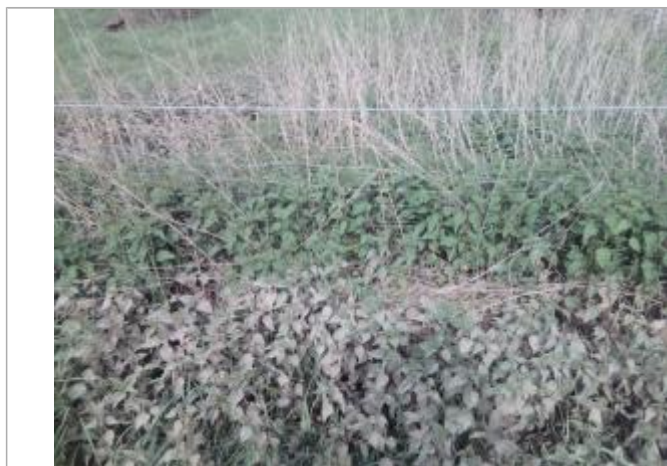
Vue du repère - auteur : Artelia

Altitude calculée de l'eau (en m) : 139.16 m