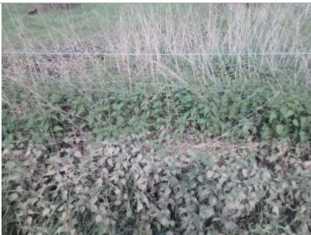
Vue du repère - auteur : Artelia