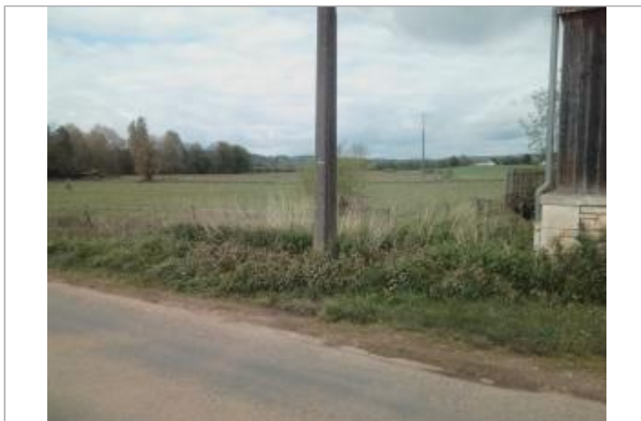
Vue du site - auteur : Artelia