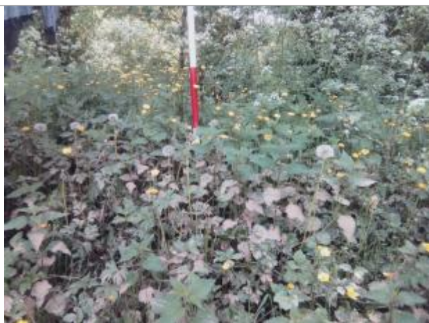
Vue du repère - auteur : Artelia