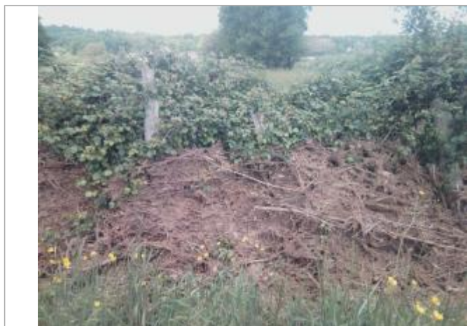
Vue du repère - auteur : Artelia