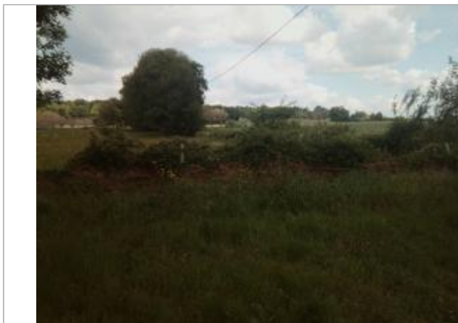
Vue du site - auteur : Artelia

Coordonnées WGS84 : X: 0.85925730 / Y: 45.18721470