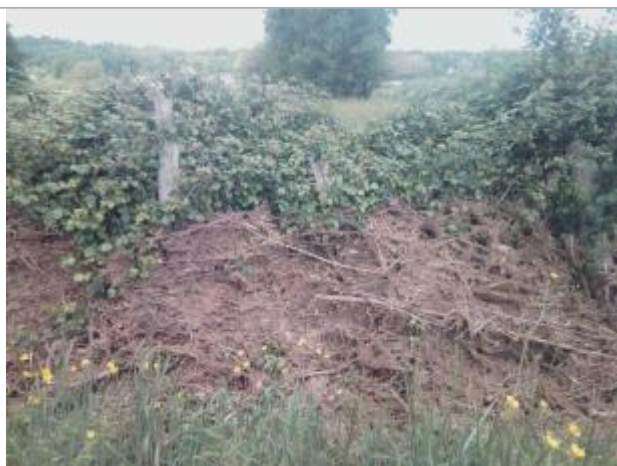
Vue du repère - auteur : Artelia