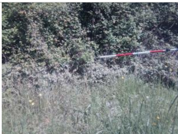
Vue du repère - auteur : Artelia