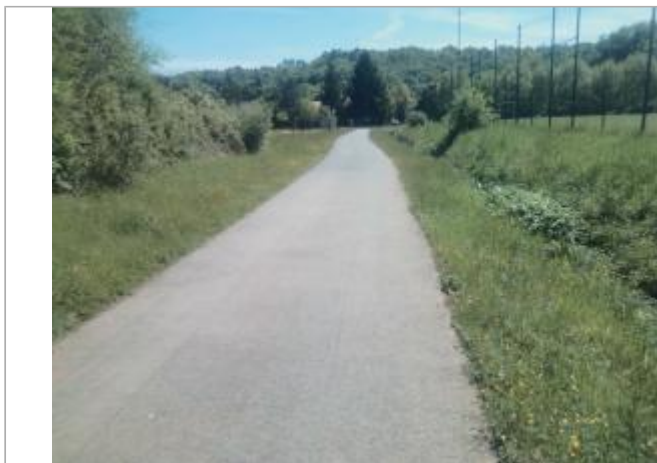
Vue du site - auteur : Artelia

Coordonnées WGS84 : X: 0.65644200 / Y: 45.18783940