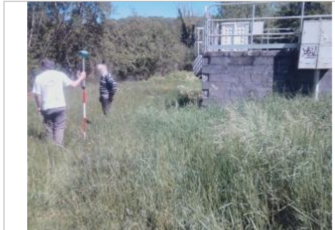
Vue du site - auteur : Artelia

Coordonnées WGS84 : X: 0.68600900 / Y: 45.19887890