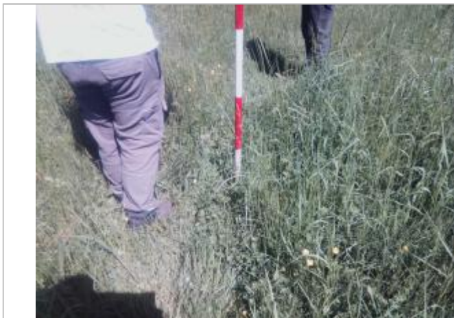
Vue du repère - auteur : Artelia

Altitude calculée de l'eau (en m) : 80.17