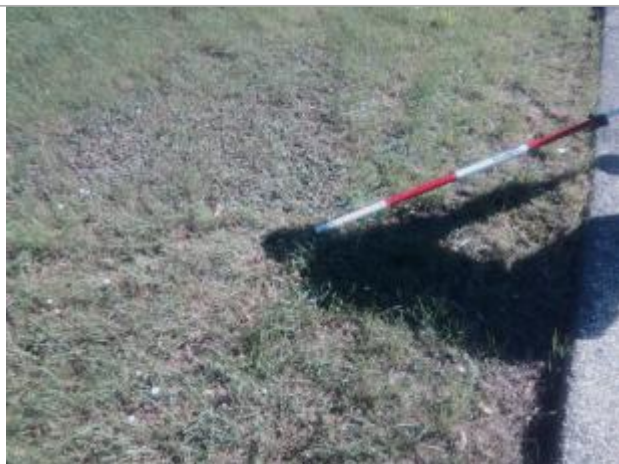
Vue du rep re

Altitude calcul e de l'eau (en m) : 81.57