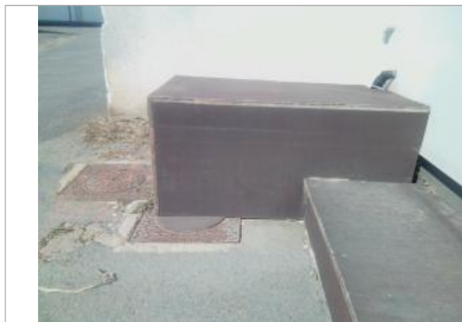
Vue du repère - auteur : Artelia

Altitude calculée de l'eau (en m) : 82.47