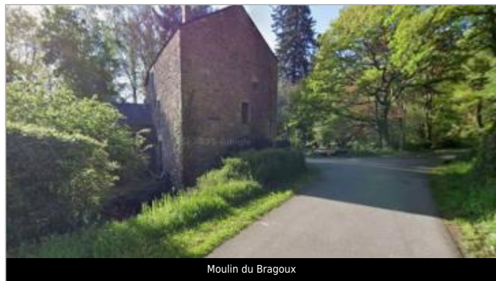
Moulin du Bragoux

GÉOLOCALISATION Coordonnées WGS84 : X: -2.38964620 / Y: 47.71535060 Coordonnées RGF93 (Lambert 93) X: 296197.31 / Y: 6748781.84 Coordonnées RGF93 (ETRS89) : X: -2.3896462 / Y: 47.7153506 Code Hydro: J88-0300 Rive de référence: