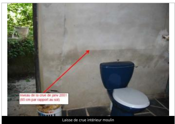
Laisse de crue intérieur moulin

MARQUE Maximum de l'inondation : Oui Visibilité : Non État du repère : Non renseigné Pérennité : Non renseigné