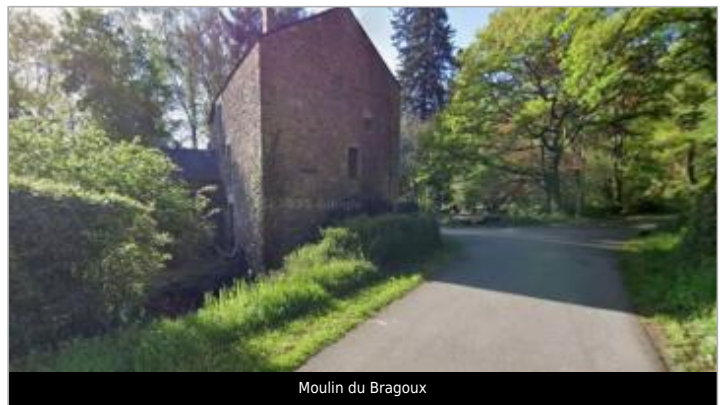
Moulin du Bragoux

GÉOLOCALISATION Coordonnées WGS84 : X: -2.38964620 / Y: 47.71535060 Coordonnées RGF93 (Lambert 93) X: 296197.31 / Y: 6748781.84 Coordonnées RGF93 (ETRS89) X: -2.3896462 / Y: 47.7153506 Code Hydro: J88-0300 Rive de référence: