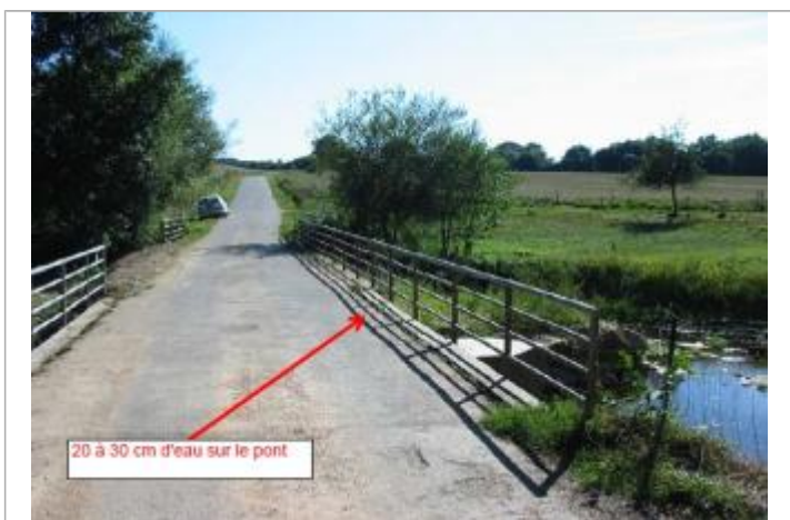
20 à 30 cm d'eau sur le pont

MARQUE Maximum de l'inondation : Oui Visibilité : Non État du repère : Disparu