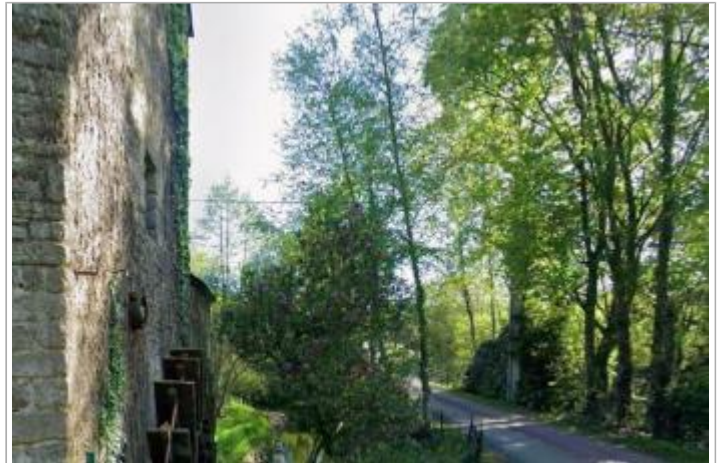
Accès au pont Moulin du Bragoux

GÉOLOCALISATION Coordonnées WGS84 : X: -2.39003534 / Y: 47.71515850 Coordonnées RGF93 (Lambert 93) X: 296166.75 / Y: 6748762.54 Coordonnées RGF93 (ETRS89) : X: -2.3900353 / Y: 47.7151585 Code Hydro: J88-0300 Rive de référence: