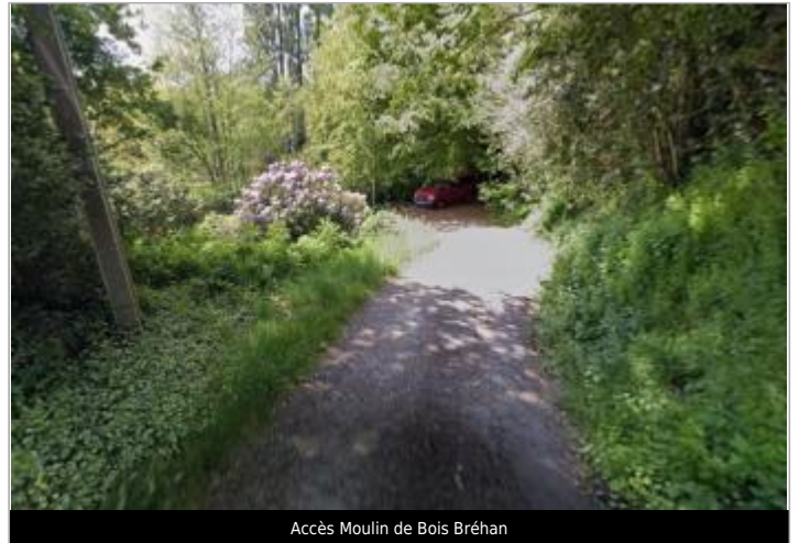
Accès Moulin de Bois Bréhan