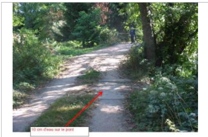
10 cm d'eau sur le pont

Maximum de l'inondation : Oui Visibilité : Non