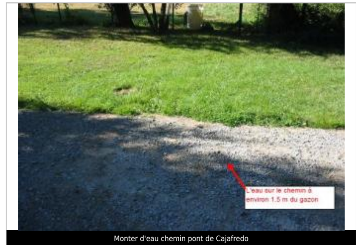
Monter d'eau chemin pont de Cajafredo