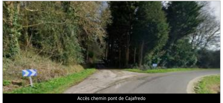
Accès chemin pont de Cajafredo