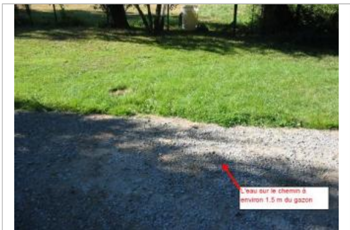
Monter d'eau chemin pont de Cajafredo