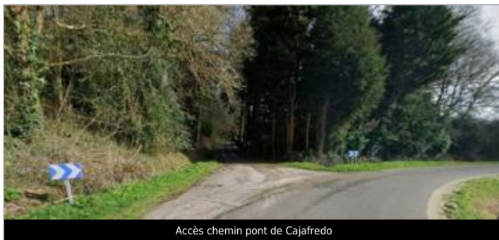
Accès chemin pont de Cajafredo