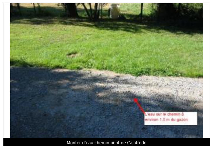
Monter d'eau chemin pont de Cajafredo