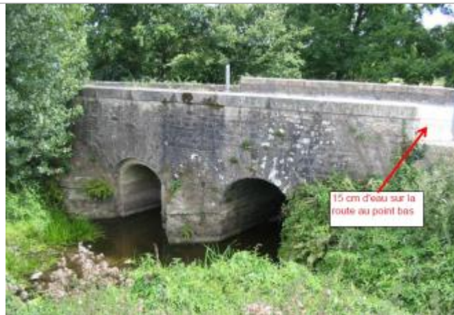
Chaussée de la RD 766, Pont Guillemet en rive gauche