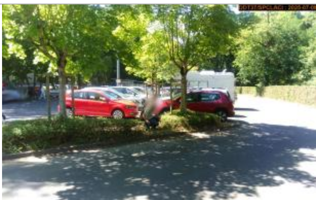
Vue du repère en 2025