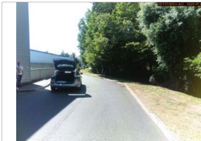
Vue du site en 2025

Coordonnées WGS84 : X: 1.01636100 / Y: 47.40517300