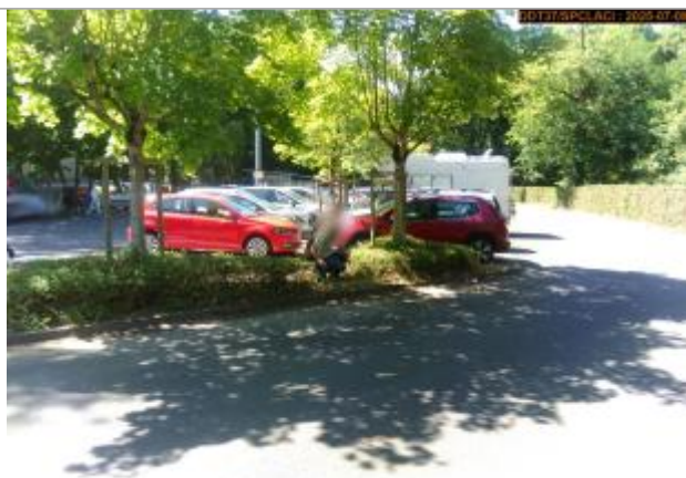
Vue du repère en 2025