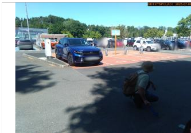
Vue du repère en 2025