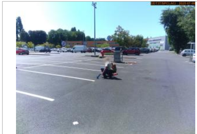
Vue du site en 2025

Coordonnées WGS84 : X: 1.01798600 / Y: 47.40446200