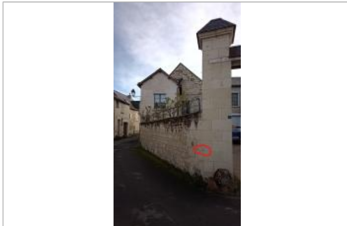
2025_Vue du site

Coordonnées WGS84 : X: 0.06661600 / Y: 47.21418440