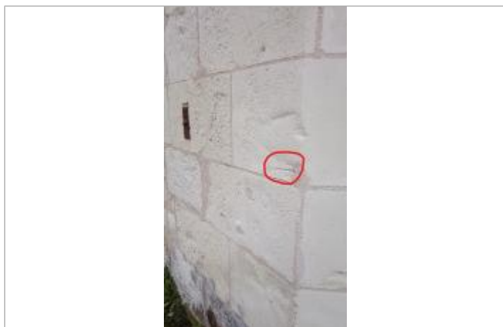
2025_Vue du repère 1993 et 1982

SOURCE DE REPÉRAGE : RECENSEMENT PAR LE SPC MLA - 06/02/2024