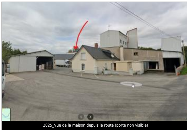
2025_Vue de la maison depuis la route (porte non visible)