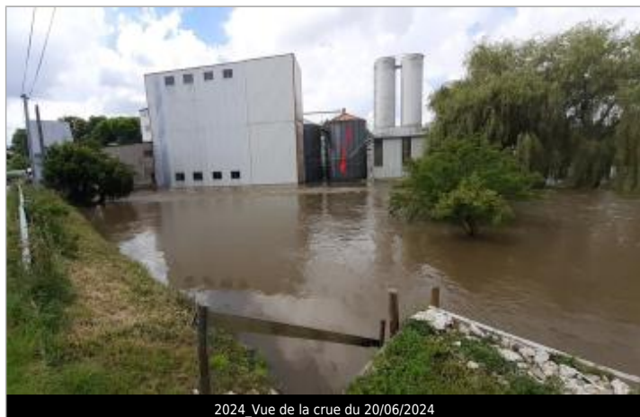
2024_Vue de la crue du 20/06/2024

SOURCE DE REPÉRAGE : RECENSEMENT PAR LE SPC MLA - 06/02/2024