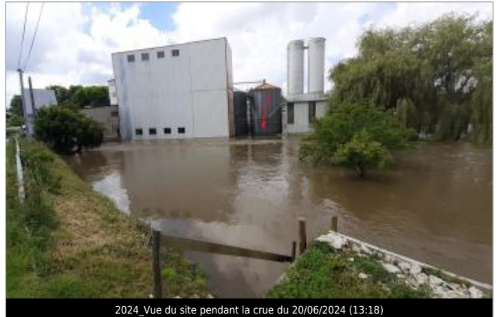
2024_Vue du site pendant la crue du 20/06/2024 (13:18)

Coordonnées WGS84 : X: -0.96016332 / Y: 47.82040010