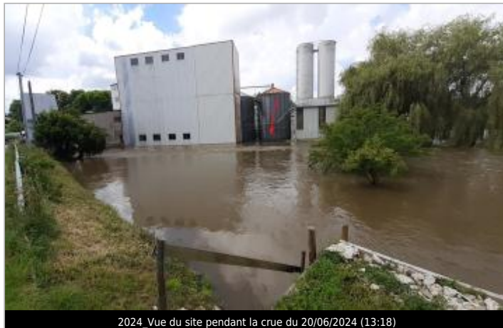
2024_Vue du site pendant la crue du 20/06/2024 (13:18)