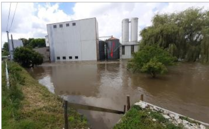
2024_Vue de la crue du 20/06/2024

SOURCE DE REPÉRAGE : RECENSEMENT PAR LE SPC MLA - 06/02/2024