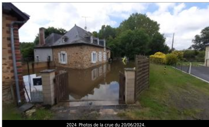
2024_Photos de la crue du 20/06/2024.