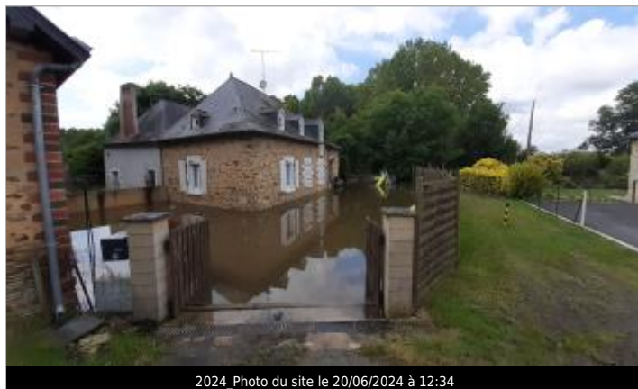
2024_Photo du site le 20/06/2024 à 12:34

Coordonnées WGS84 : X: -0.94723471 / Y: 47.79477540