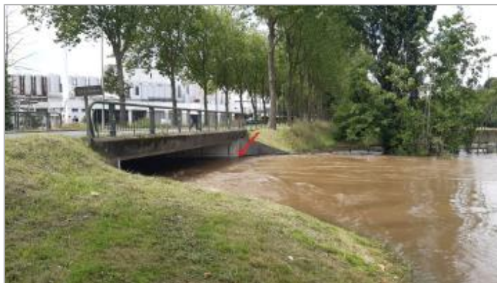
2024_Photo de la crue du juin (14:06)