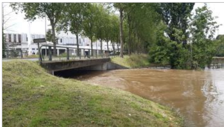
2024_Photo lors de la cruedu 20/06/2024 (14:06)

SOURCE DE REPÉRAGE : RECENSEMENT DDT DU MAINE-ET-LOIRE - 09/02/2018