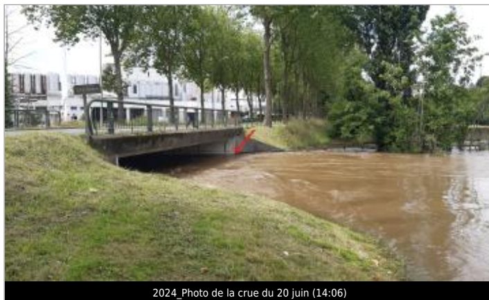
2024_Photo de la crue du 20 juin (14:06)