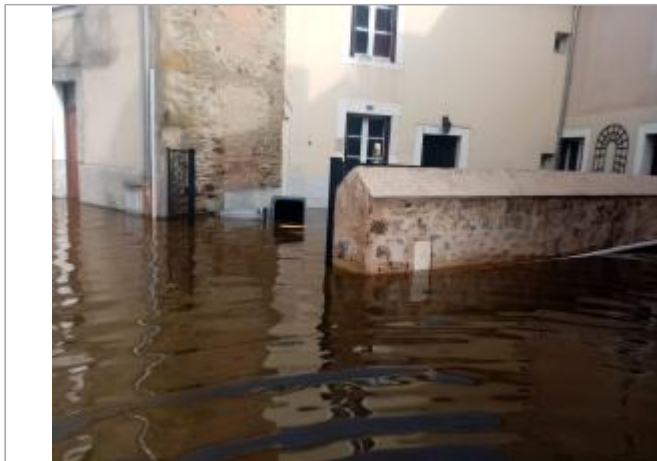
2024_Photo lors de la crue_09:45

Coordonnées WGS84 : X: -0.95288567 / Y: 47.84829250