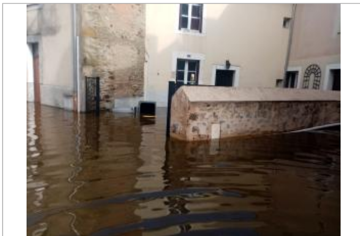
2024_Photo lors de la crue_09:45