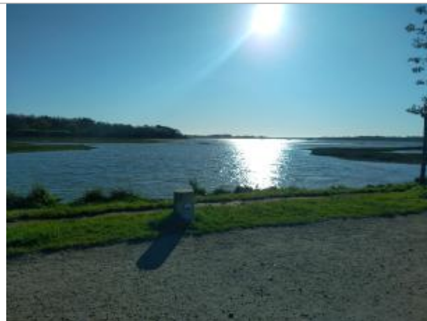
Presqu'île de Conleau - Vannes