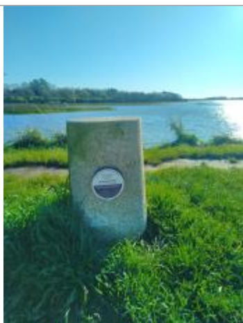
Repère de submersion - Conleau - Vannes

Altitude calculée de l'eau (en m) : 3.15 m