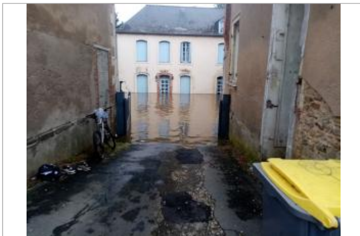
2024_Vue du portail lors de la crue