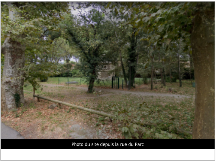
Photo du site depuis la rue du Parc