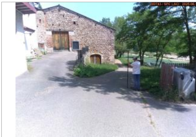
Vue du site en 2025

Coordonnées WGS84 : X: 4.19568600 / Y: 45.35991000