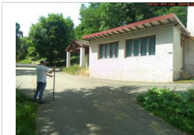
Vue du repère en 2025