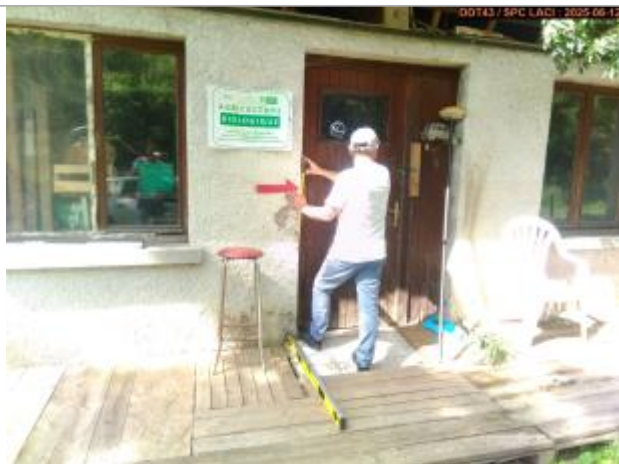
Vue du repère en 2025

Altitude calculée de l'eau (en m) : 523.773