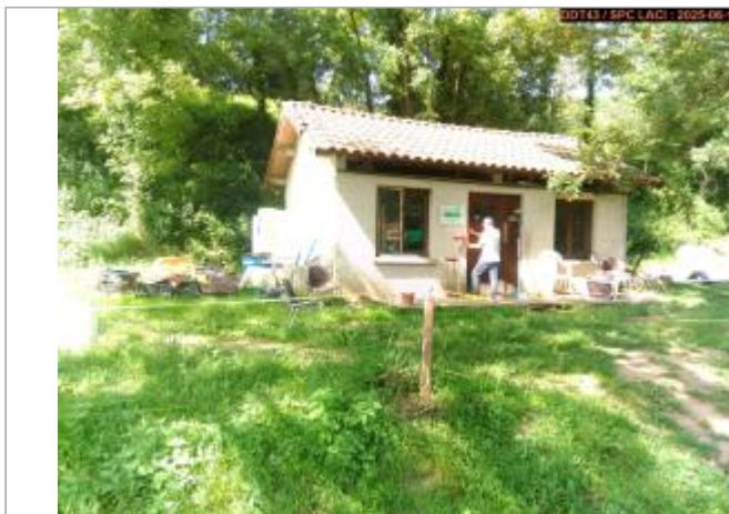
Vue du site en 2025

Coordonnées WGS84 : X: 3.95324700 / Y: 45.20503200