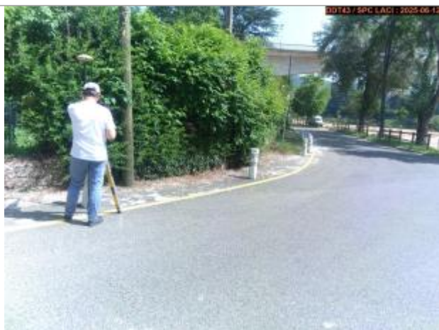
Vue du repère en 2025