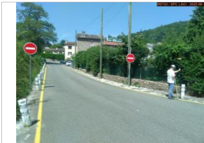
Vue du site en 2025