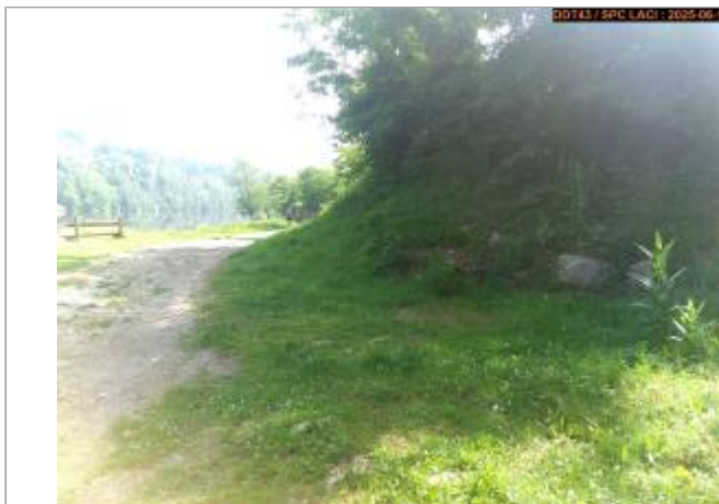
Vue du site en 2025

Coordonnées WGS84 : X: 4.19993200 / Y: 45.37498700