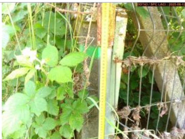
Vue du repère en 2025