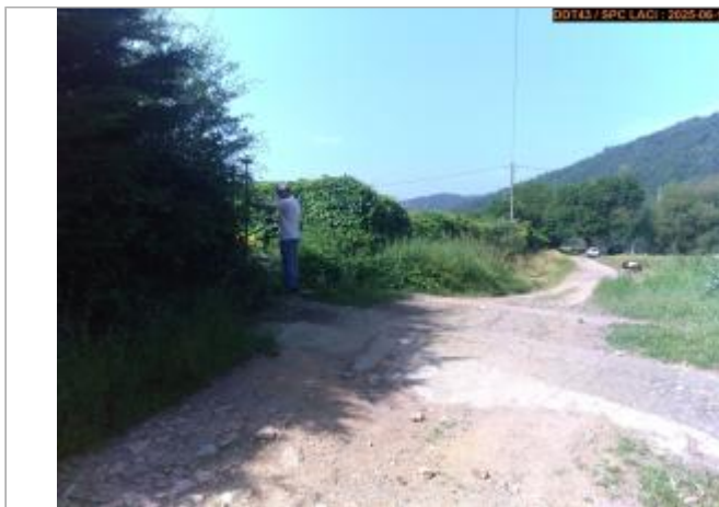
Vue du site en 2025

Coordonnées WGS84 : X: 4.20431700 / Y: 45.37687700