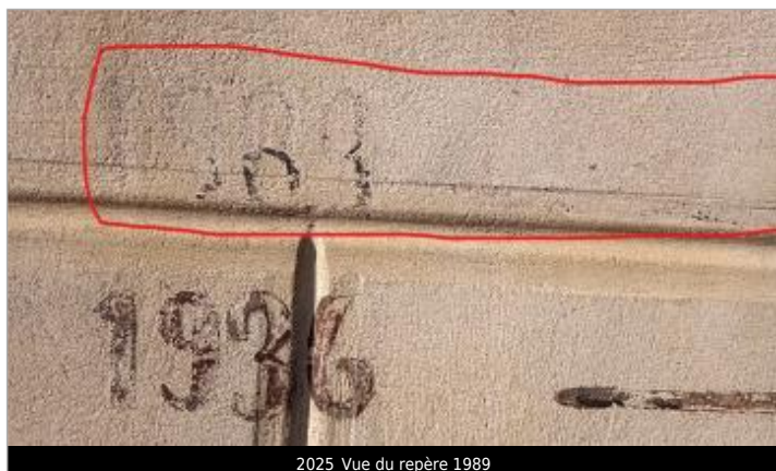
2025_Vue du repère 1989

SOURCE DE REPÉRAGE : RECENSEMENT PAR LE SPC MLA - 06/02/2024