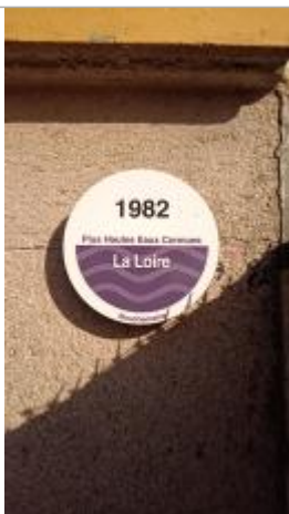
2025_Vue du repère 1982

Altitude calculée de l'eau (en m) : 19.82 m